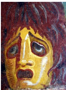
Máscara trágica romana.

¿Cómo eran las máscaras griegas y romanas?