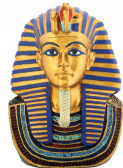
Máscara mortuoria del faraón Tutankamón

Un material comúnmente usado para crear las máscaras egipcias fue el oro, con el que además se quería representar la riqueza que habían poseído. Comúnmente a las personas que habían tenido mucho poder en vida, como los faraones, usaban este tipo de máscaras.